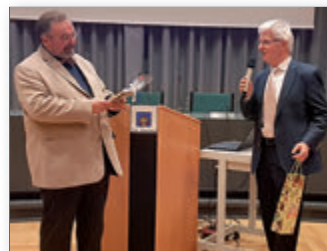
Samstagsforum Hildesheim Veränderungen in der Kirche