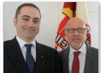
Lange Tradition 150 Jahre KKV Freiburg