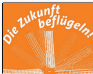
Ökumene im Blick 90. Bundesverbandstag