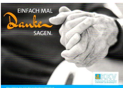
Motiv 1 – Hände