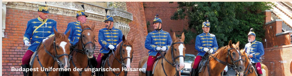
Budapest Uniformen der ungarischen Husaren